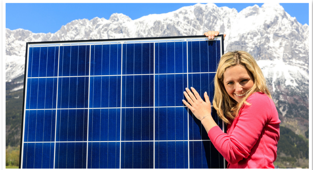
Die Sonne schickt keine Rechnung.

Einziger Wehrmutstropfen: Um zu einer Förderung zu kommen, muss man einen wahren Marathon durchlaufen und Anlagen